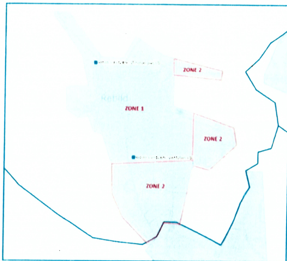
Forsyningszone 1 og 2.